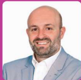
Ο ΠΡΟΕΔΡΟΣ ΤΗΣ ΚΟΙΝΩΦΕΛΟΥΣ ΔΗΜΟΤΙΚΗΣ ΕΠΙΧΕΙΡΗΣΗΣ ΜΑΡΚΟΠΟΥΛΟΥ (Κ.Δ.Ε.Μ.)