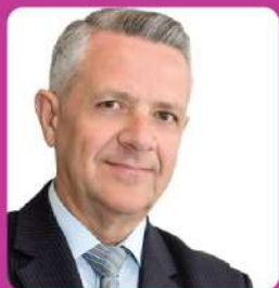
Ο ΔΗΜΑΡΧΟΣ ΜΑΡΚΟΠΟΥΛΟΥ ΜΕΣΟΓΑΙΑΣ