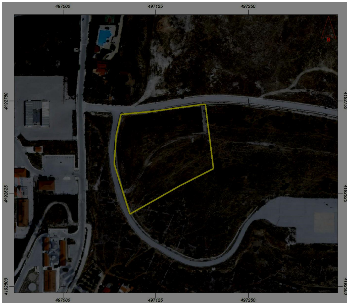
Σχ.3.2. Αεροφωτογραφία με τη θέση του πεδίου άρδευσης