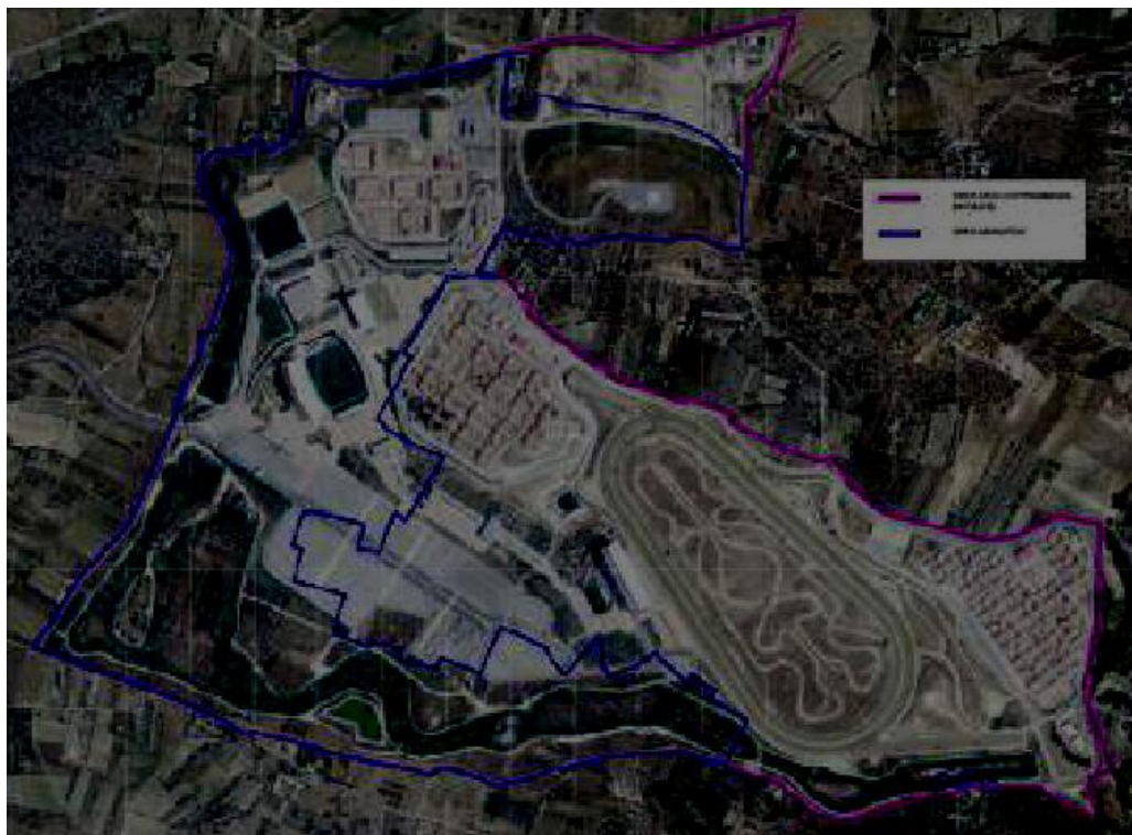
Σχ.1.2. Αεροφωτογραφία με τη θέση του γηπέδου της δραστηριότητας και του βιολογικού καθαρισμού

των θέσεων των κερκίδων, ενώ ο μέγιστος αριθμός εκτροφής ίππων είναι 1.612 με βάση των αριθμό των στάβλων της εγκατάστασης.